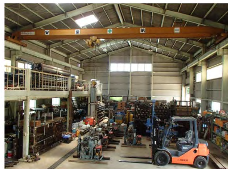
菊池機材センター内部

八洲開発は、敷地面積およそ1,000坪の機材センターを熊本北工業団地内に所有しています。機材センターでは、ボーリング機械や付属機器の整備・点検及び各種部品の加工を行なっています。自社による一貫した管理のもと、機材の整備から現場作業までを効率的に行い、井戸の高品質仕上げに万全を期しております。