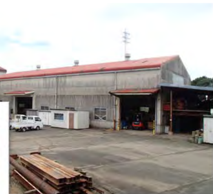
菊池機材センター外観